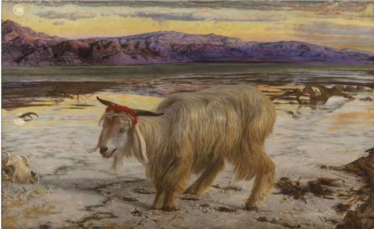
Уильям Холман Хант (1827-1910), «Козел отпущения»

Когда первосвященник клал жребии на козлов и возглашал «Грехоочистительная жертва Господу», произнося при этом Непроизносимое Имя, священники и народ, стоявшие во дворе Храма, преклоняли колени, падали ниц и восклицали: «Благословенно Имя Царствия Его во веки веков!». Затем первосвященник привязывал к рогам козла отпущения моток красной шерсти, символизирующий грехи, и отводил его к воротам, через которые его отсылали. Такой же моток привязывали к рогам козла, предназначенного для жертвенника.