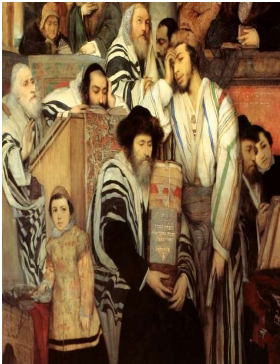
Мауриций Готлиб. Евреи молятся в синагоге на Йом-Киппур. Вена, 1878

Все, что вы хотели узнать, но боялись спросить о законах, обычаях и богослужении Рош áа-Шана и Йом Кипура