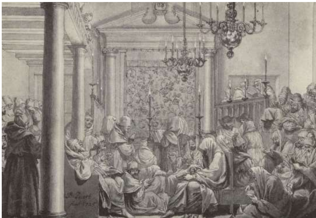
Йом Кипур. Еврейская открытка с гравюры Пикара.

В Амиде вместо «запиши нас в книгу Жизни» произносят «запечатай нас в книгу Жизни».