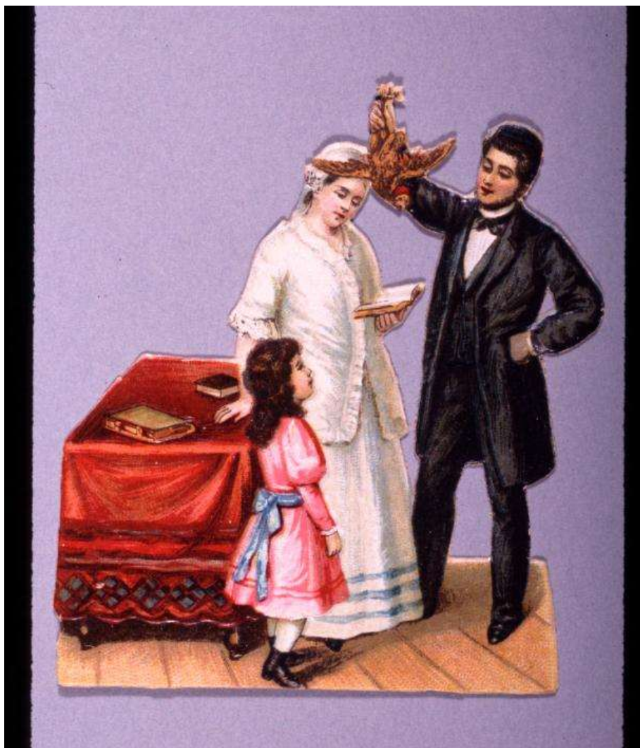
Кипарот. Литография начала XX века

Накануне Йом Кипура в послеполуденной молитве произносят специальную исповедь (видуй), включающую отрывки «Мы грешили» и «За грех». Почему это нужно сделать перед заключительной трапезой?