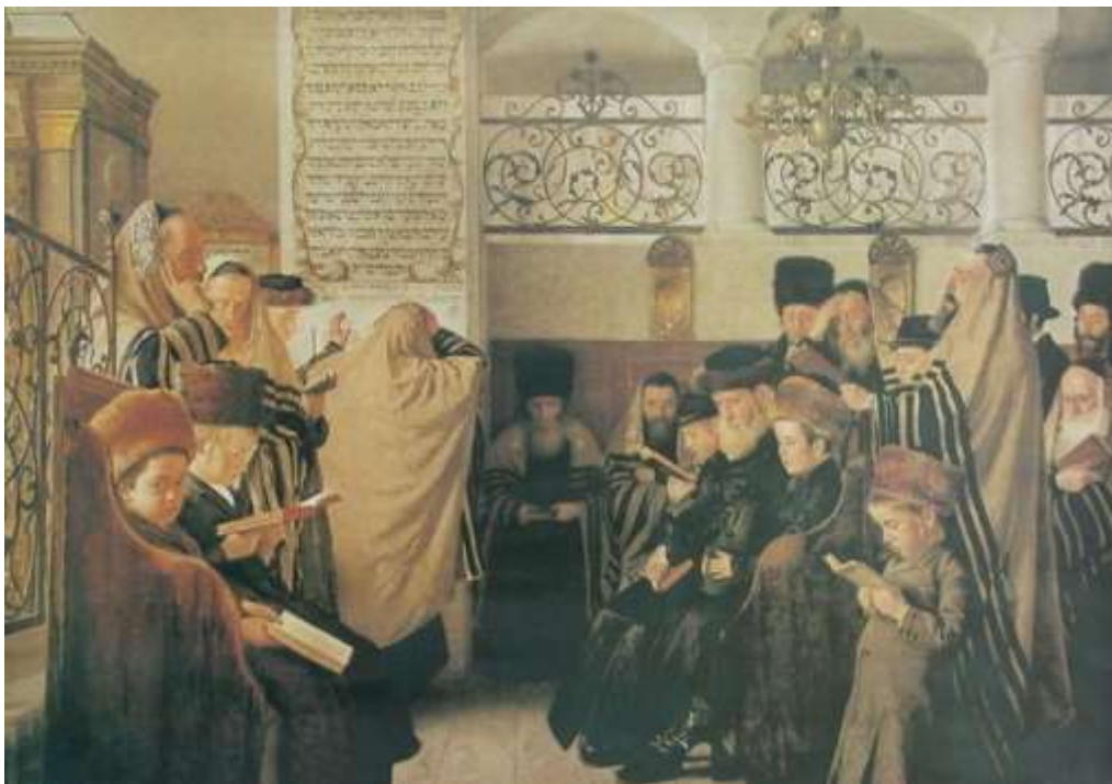
Исидор Кауфманн (1853-1921). Йом Кипур

Некоторые полагают, что этот обычай – память о храмовом служении священников, совершавших его стоя.