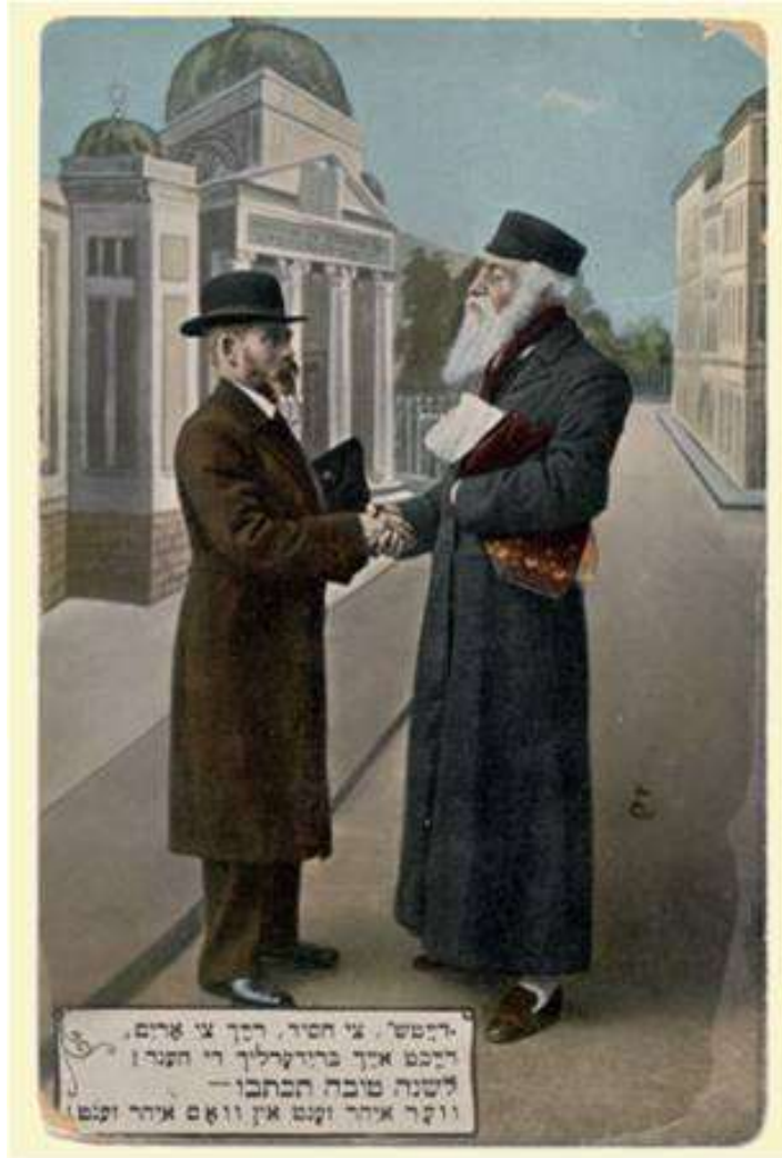
Рош га-Шана, традиционная еврейская поздравительная открытка. Начало XX века

Почему, в отличие от Песаха, Шавуота и Суккота, ни Рош га-Шана, ни Йом Кипур не называют в молитвах «праздники (моадим) для радости, праздничное время для веселья»?