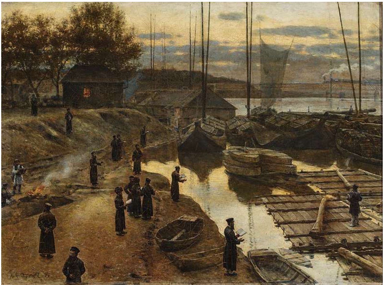
Александр Герымский, Ташлих, 1884